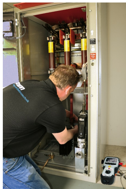
Preparación del Microhmímetro MOM 2

Acto seguido, pasamos por seguridad, a medir las resistencias de contacto del interruptor, cuyo disparo dio lugar a la caída del servicio de las bombas. Para esos casos, contamos con nuestro microhmímetro MOM 2 de Megger en nuestra instrumentación de emergencia. Gracias a su dimensión compacta y peso reducido de apenas 1 kg, podemos encontrarle sitio en cualquier lugar del vehículo.