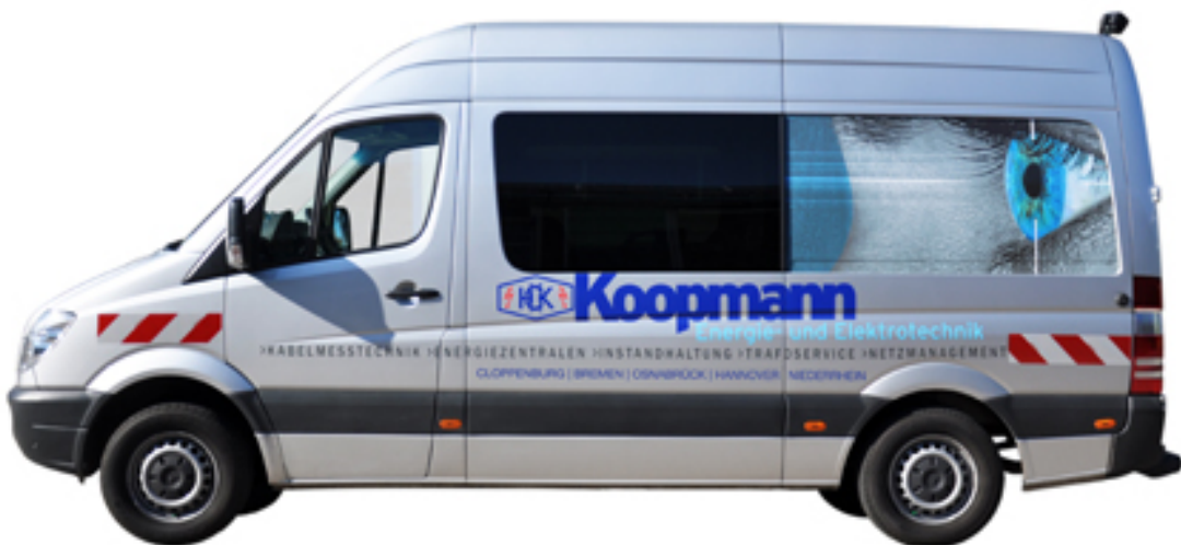
El sistema en vehículo de medición SebaKMT Centrix TE de Megger

Cómo Koopmann Energie- und Elektrotechnik pudo resolver con éxito una situación de emergencia gracias a los sistemas Centrix y TDS NT de Megger para mediciones de cables.